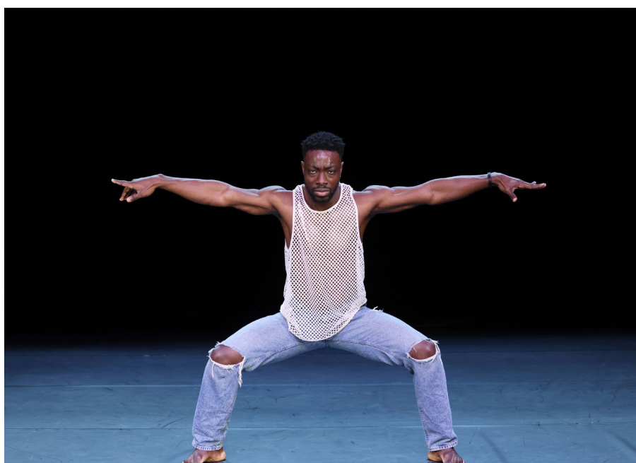
[Superstrat] © Patrick Berger